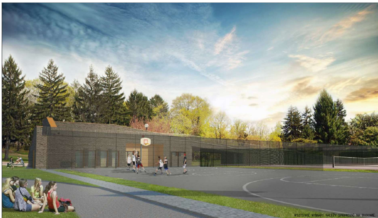
Wizualizacja 2 przedstawiająca tereny rekreacyjne po przebudowie